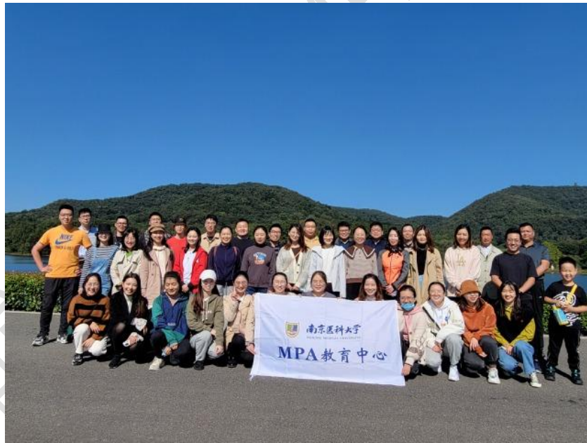
图 12 浦口区象山湖公园举办“百年风雨路 青春新征程”师生共建入学素质拓展活动