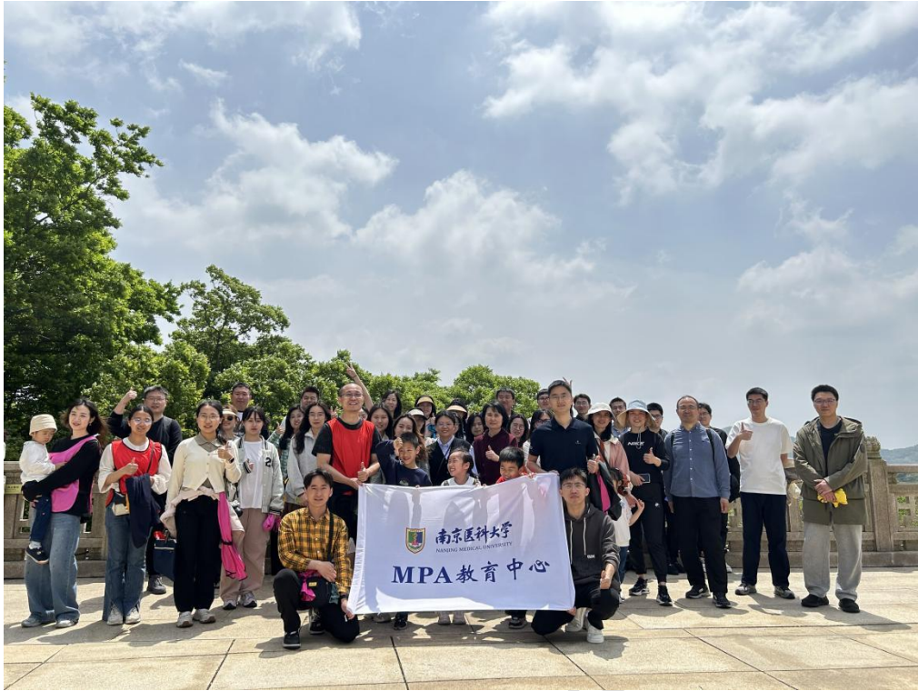
图 13 江宁区牛首山举办师生共建入学素质拓展活动

招生咨询电话：025-86862364（詹老师）、025-86868590（郭老师）