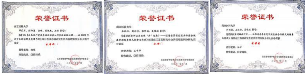
图组 7 2021 年江苏省研究生公共管理案例分析大赛二等奖、三等奖