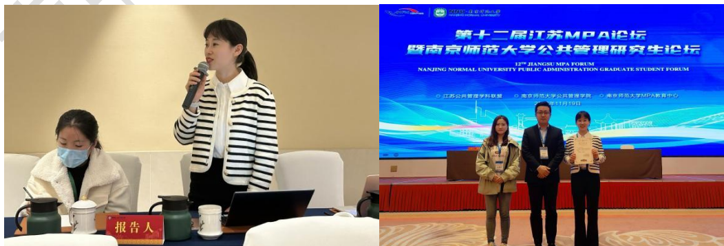
图组 10 第十二届江苏 MPA 论坛优秀论文二等奖、三等奖