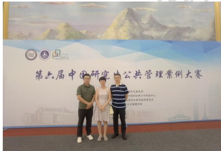
图组 3 第六届中国研究生公共管理案例大赛优秀组织奖、三等奖