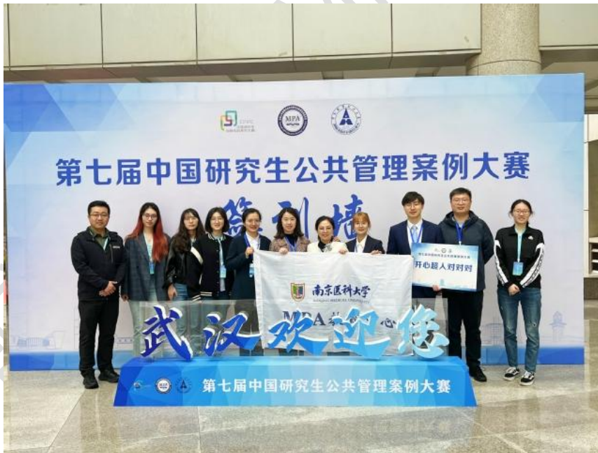
图组 4 第七届中国研究生公共管理案例大赛优秀组织奖、二等奖、 三等奖