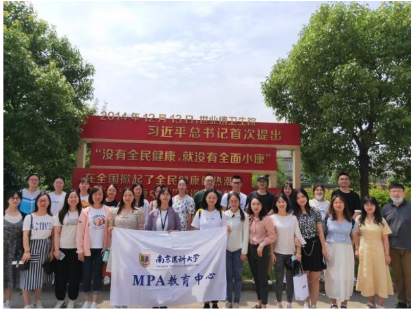
图 11 重走习近平总书记视察点，镇江市丹徒区世业洲开展红色素质拓展活动