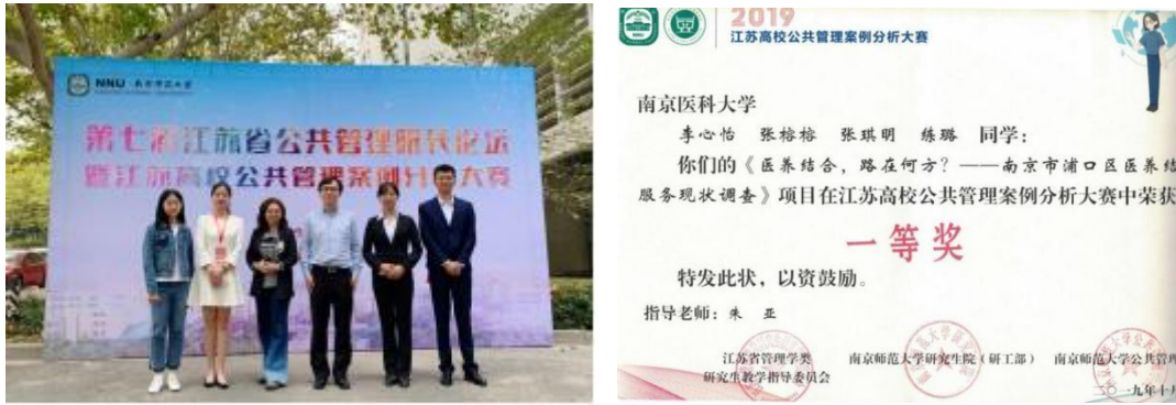
图组 5 江苏高校公共管理案例分析大赛一等奖