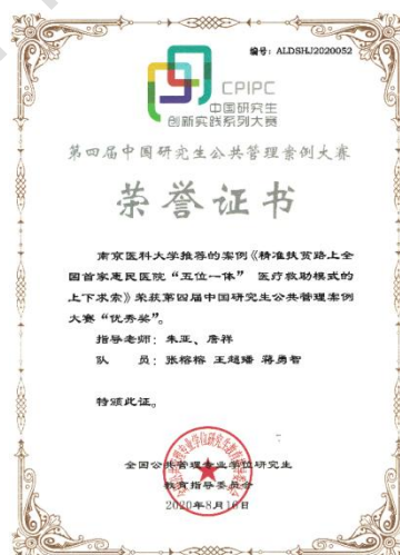
图2 第四届全国研究生公共管理案例大赛优秀奖（百强）