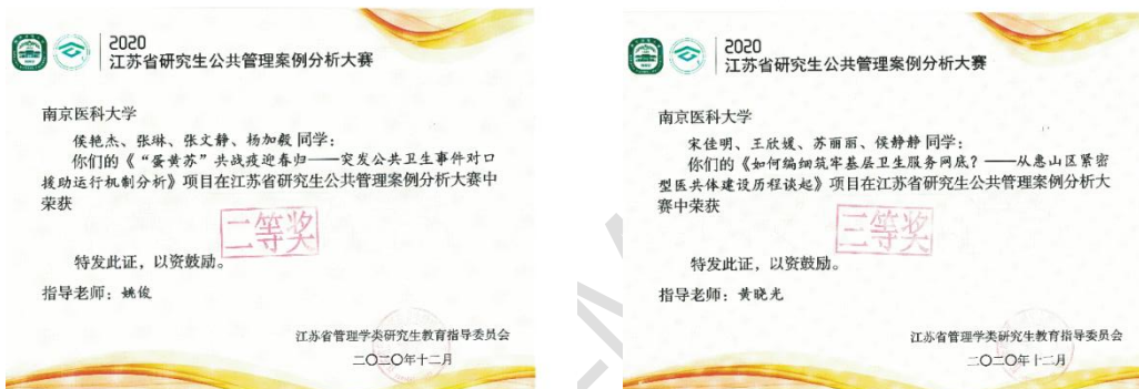
图组 6 第二届江苏省公共管理案例大赛二等奖、三等奖