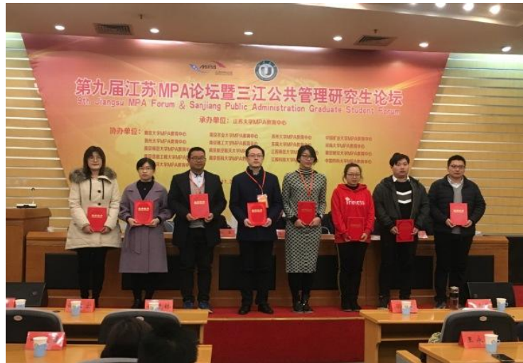
图组 9 第九届江苏 MPA 论坛优秀论文一等奖、二等奖