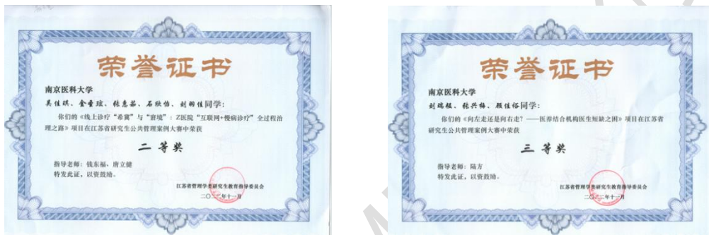
图组 8 2022 年江苏省研究生公共管理案例分析大赛二等奖、三等奖