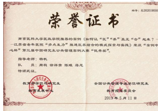
图1 第三届全国研究生公共管理案例大赛优秀奖（百强）